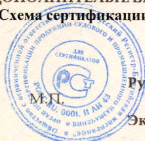
Схема сертификации 3.